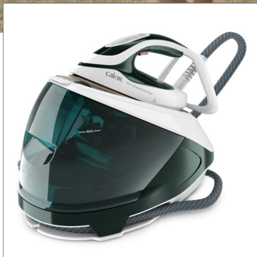
Pro Express Eco, Centrale vapeur éco conçue, 7,5 bars, pression 140 g/min, fonction pressing 560 g/min Centrale vapeur GV9E20C0