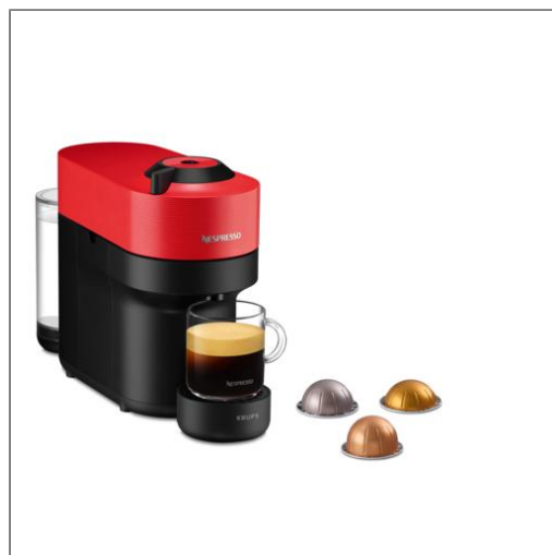
Nespresso VERTUO POP Rouge piment Nespresso YY4888FD