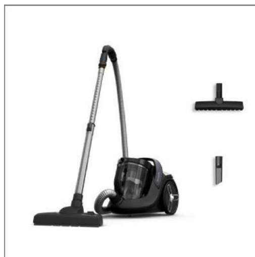
GREEN FORCE CYCLONIC EFFITECH Aspirateur sans sac YY5269FE